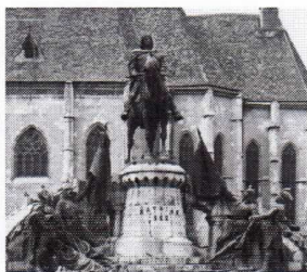
Fülöppjakabért Alapítvány Kuratória