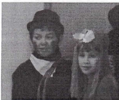
A kéményseprő és Mátyás király