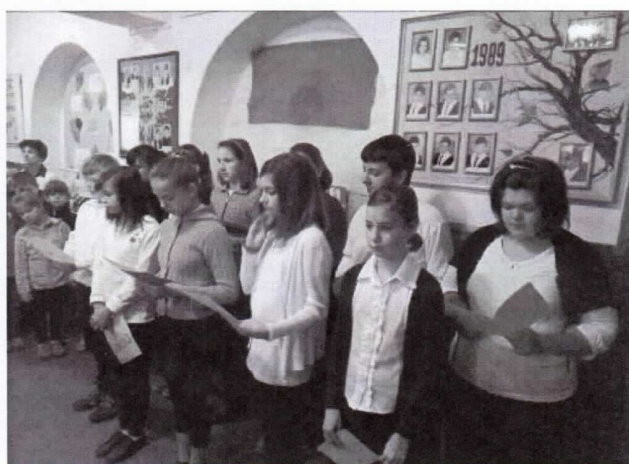
Október 6-án a hatodik osztályos tanulók műsorával emlé- keztünk meg az aradi vértanúkról.