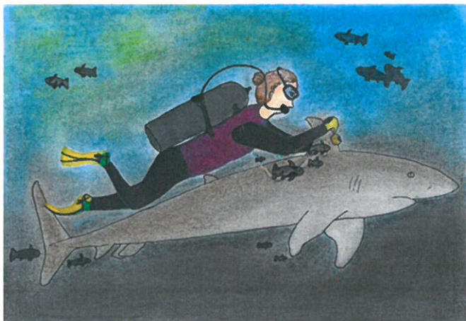
Bakró Réka rajza